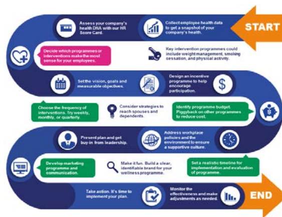
Figura 2: Enfoque realizado por International SOS para la prevención de las ENT y el bienestar en el lugar de trabajo

correspondan con los del sistema de atención de la salud en el que desarrollan su actividad.