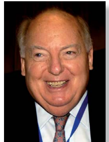
Abraham KATZ – Président OIE

Un fait marquant de l'année a été la participation du United States Council for International Business (USCIB) au lancement officiel du rapport Doing Business 2008 , publication emblématique de la Banque mondiale. Cette activité a un impact sur nos futures relations avec cette très importante institution et nous sommes convenus de nous réunir régulièrement au plus haut niveau avec la Banque.