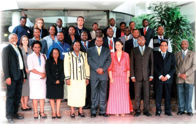
Les participants de la réunion sur le VIH/SIDA à Nairobi